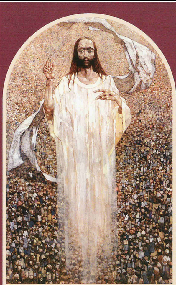
Stacja XV - Zmartwychwstanie