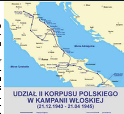
UDZIAŁ II KORPUSU POLSKIEGO W KAMPANII WŁOSKIEJ (21.12.1943 - 21.04.1945)

Warto pamiętać o szlaku bojowym II Korpusu bo jego żołnierze byli jednymi z budowniczych naszej świątyni i Ośrodka. Warto idąc wzdłuż prawej ściany naszej świątyni zatrzymać się przy tablicy pamiątkowej wmurowanej w ścianę świątyni aby uczcić pamięć tych, którzy przeszli szlak od Rzymu do Arno...